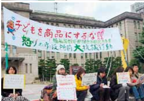
保育所のプール制も改悪。保育水準と労働者の賃金水準を崩しました。