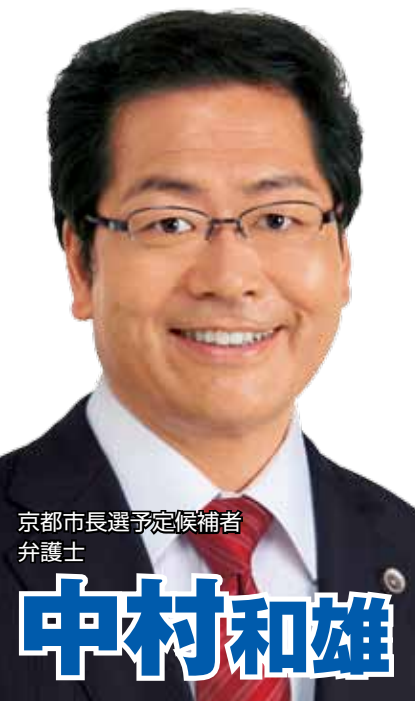
京都市長選予定候補者 弁護士