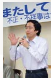
市政の不正・不祥事を 徹底追及

行政監視にとりくむオンブズマン グループ「市民ウォッチャー・京都」 の事務局長として、市民目線で市政を チェック。同和利権など京都市政の ムダ・不正・不祥事、市民感覚から かけ離れた異常な体質を暴き、違法 な支出を市長などに弁償させたり、 未然に防いだりしてきました。